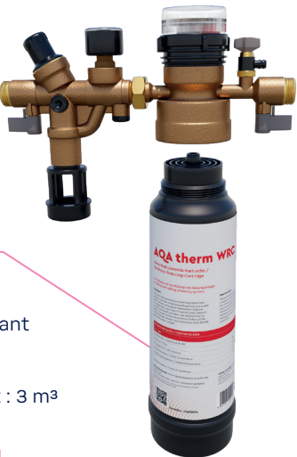
Cartouche WRC 2XL avec rampe HES

» WRC 2XL, la nouvelle cartouche d'adoucissement qui réinvente le remplissage