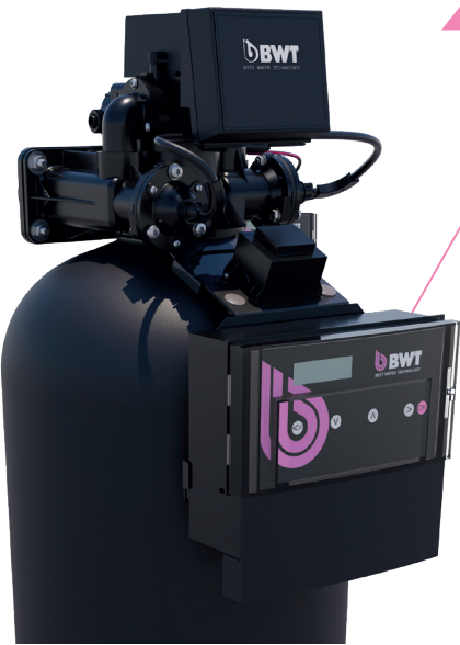
Adoucisseur BWT Pro Max 75 L

« Des fonctionnalités avancées qui redéfinissent les standards de performance. »