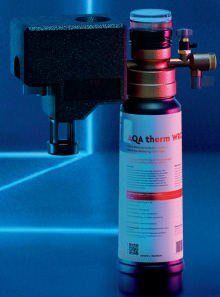
BWT Aqa Therm SYSTÈME DE REMPLISSAGE EN EAU ADOUCIE L'alternative écoresponsable pour les petits circuits.