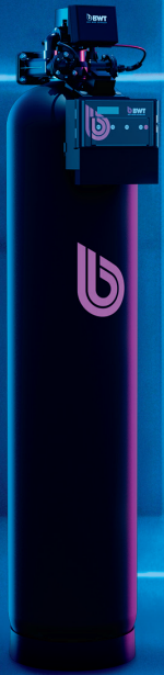
BWT Pro Max ADOUCISSEURS D'EAU La performance, tout simplement.