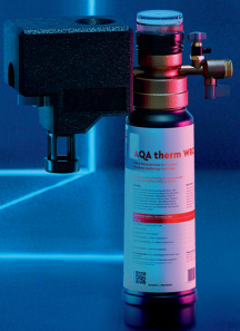
BWT Aqa Therm SYSTÈME DE REMPLISSAGE EN EAU ADOUCIE L'alternative écoresponsable pour les petits circuits.