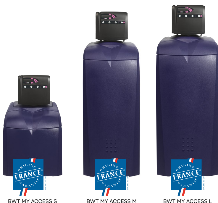
BWT MY ACCESS S

3 modèles, des fonctions essentielles, la connectivité en plus !